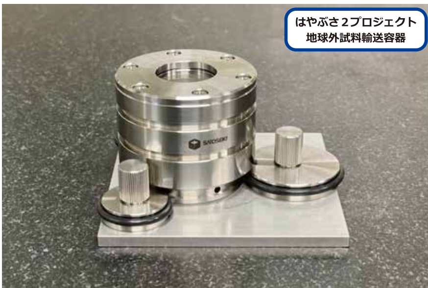
はやぶさ2プロジェクト 地球外試料輸送容器