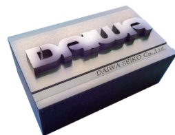
【ワイヤ放電加工サンプル】