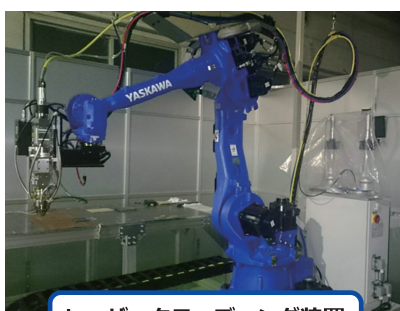
レーザークラッディング装置