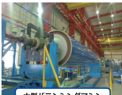
大型バランスングマシン